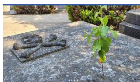
Kerkhof Bavel Herengracht 10, 3721 XG Bavel

https://www.facebook.com/Kerkhof-Bavel-104410621933074/